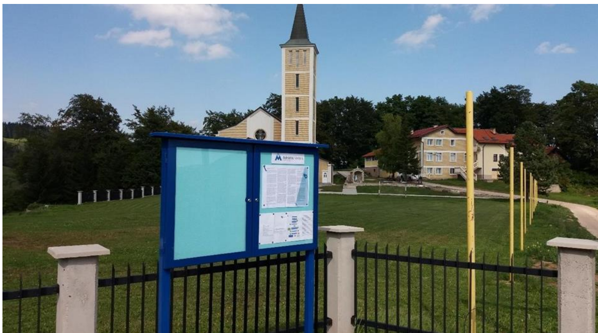
Slika 4.1.1. Oglasna tabla Borovica

Dokumenti i izvještaji koji su preveliki da bi bili objavljeni na oglasnim tablama će na bosanskom jeziku biti dostupni u Informativnom centru i bit će ih moguće preuzeti sa Adriatic Metals web stranice te će biti dostupni i kod predsjednika mjesnih zajednica.