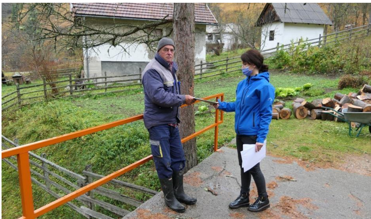
Fotografija 8.1: Distribucija netehničkog sažetka u Borovici