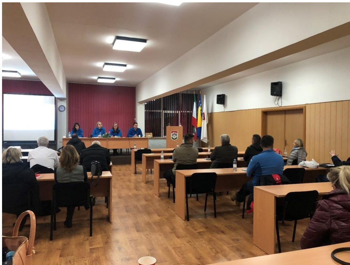
Fotografija 8.2: Javna rasprava u Varešu