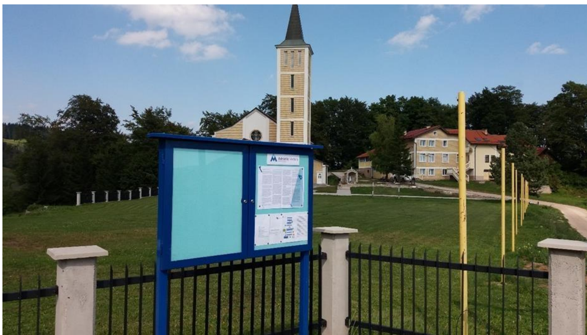
Fotografija 82 Oglasna tabla kompanije Adriatic Metals u Borovici