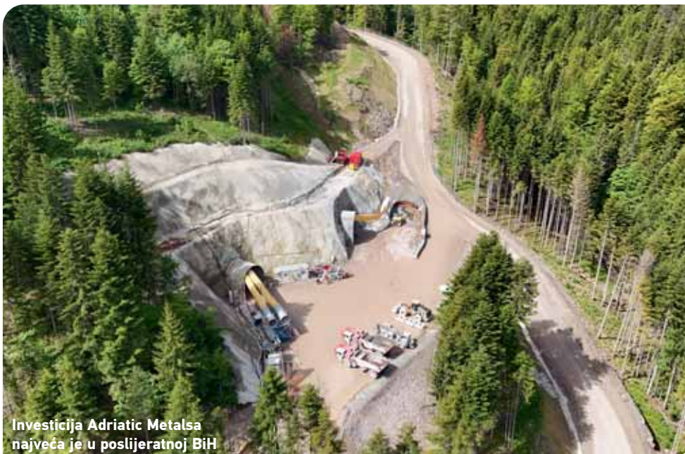
Investicija Adriatic Metalsa najveća je u poslijeratnoj BiH

meno korištenje zemljišta krenula putem razvoja te od mjesta bez ikakve perspektive, iz kojeg su stanovnici odlazili sa kartom u jednom smjeru, postala mjesto poželjno za život. Može, naravno, i drugačije - da zbog naših preporucavanja, sujeta, lažne brige za državu, ubijemo svaku nadu tih ljudi i poručimo investitorima da bježe od nas i naših budalaština. A možda smo zaista mi u Vladi u krivu, kada smo mislili da činimo dobro Varešu i njegovim stanovnicima. Neki očito misle da je bolje da ostane besperspektivna šikara koja će se zvati državna, nego perspektivna investicija na zemljištu koje je također državno”, glasi komentar federalnog premijera Nermina Nikšića o odluci Ustavnog suda, koji vjerno ilustrira nedoraslost Vlade ovom velikom investicionom projektu, koja se dodatno očitava u činjenici da se ne radi o stavu izraženom putem zvaničnih kanala, već u obliku statusa na Facebooku!? S druge strane, u Adriatic Metalsu su neuporedivo konkretniji - na pitanje o