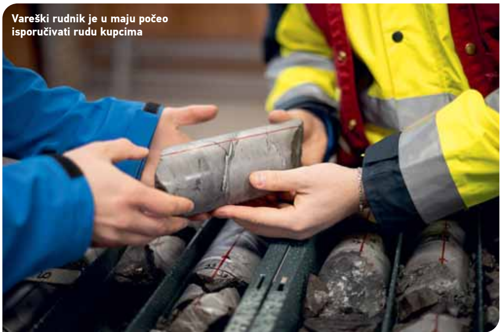
Vareški rudnik je u maju počeo isporučivati rudu kupcima

“Da budem potpuno jasan, Vlada svojom odlukom nije mijenjala titulara zemljišta - ostaje državno, ali smo u skladu sa prokla-