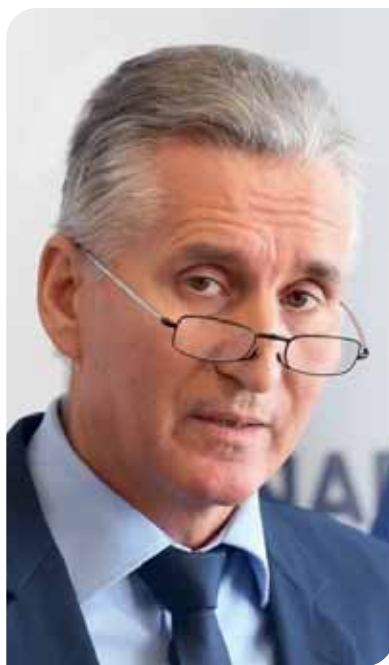
Ademović je osporio ustavnost Vladine odluke

“Projekt Vareš je uspješno ušao u fazu proizvodnje. S ponosom ističemo da je prva pošiljka koncentrata poslana u Luku Ploče već krajem maja, nepuna tri mjeseci